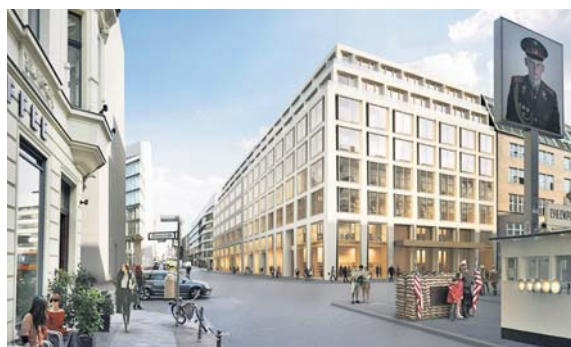
So könnte ein Wohn- und Geschäftshaus am ehemaligen alliierten Kontrollpunkt Checkpoint Charlie aussehen.