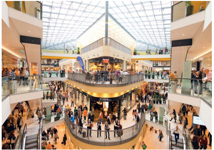
Mit der Dortmunder Thier Galerie besitzt Hamburg Trust auch ein großes Shoppingcenter in Nordrhein-Westfalen.