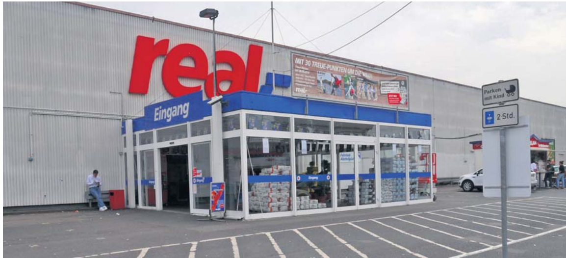
Der real-Markt in der Mainzer Straße in Wiesbaden müsste dringend renoviert werden.