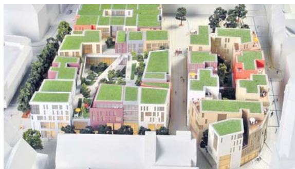
Mit diesem Modell wirbt die Stadt Jena um die Zustimmung für die Eichplatzbebauung.

Das Hü und Hott um den Eichplatz im Herzen der wachsenden, gut 100.000 Einwohner zählenden Stadt tobt seit bald einem Vierteljahrhundert. Ab 1992 regte sich Widerstand gegen erste Ideen mit großen, klotzigen Gebäuden, 1993 leiteten die Stadtväter das erste Bebauungsplanverfahren ein. Um ihre Chancen im Rennen um den lukrativen Bauplatz zu erhöhen, taten sich Jenawohnen und die zum Sparkassenlager gehörende OFB Mitte 2012 zusammen. Im März 2013 legten sie ein gemeinsames Konzept vor und setzten sich gegen namhafte Konkurrenten wie die Hamburger ECE durch. Jetzt trommelt das Duo mit einem öffentlichen Stadtmodell für die Zustimmung der Bürger. gg