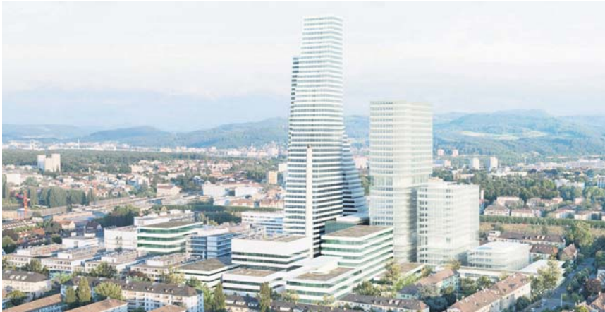
Spätestens ab 2022 wird das Roche-Areal die Silhouette von Basel beherrschen und darüber hinaus das größte Schweizer Hochhaus stellen.

Kommerz trifft Architektur: Der Pharmakonzern Roche bekennt sich zu seinem Basler Stammsitz und beschert der Stadt durch Neubaupläne am Konzernhauptszitz eine neue Silhouette. Eine milliarden schwere Investition, die auch tausenden deutschen Pendlern zugute kommt.