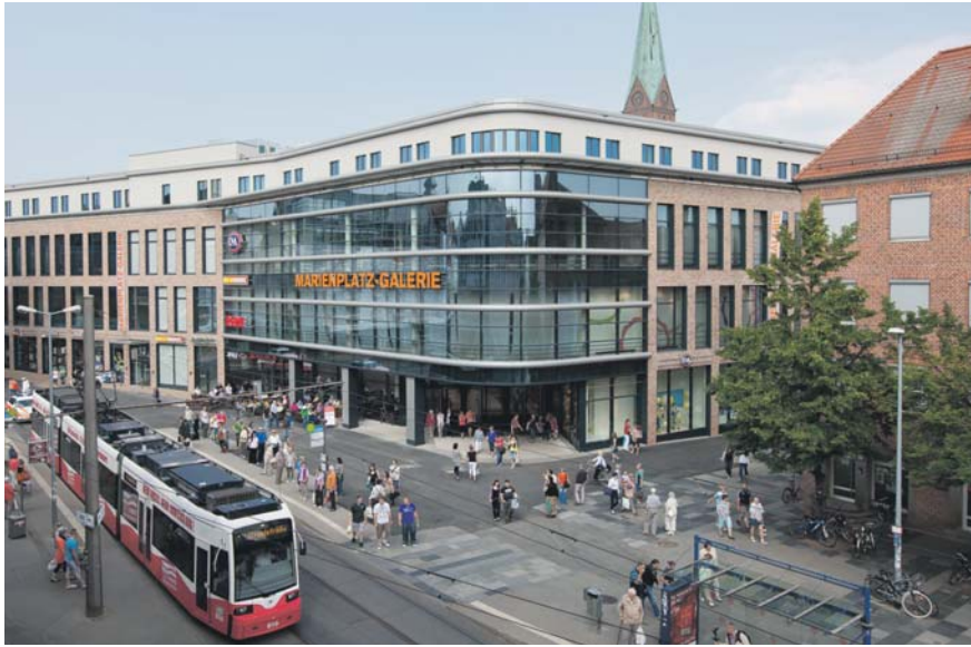
Für eine Versicherung solide genug: Co-Investor der Marienplatz-Galerie in Schwerin ist die AachenMünchener.

Ähnlich wie für die Aachener Grund zählen Leipzig und Dresden inzwischen auch zum Investitionskanon der Fondsgesellschaft Reef. Die Tochter der Deutschen Bank hat zuletzt ein Geschäftshaus in Dresden (für einen Spezialfonds) und eine Einkaufspassage in Leipzig (für den offenen Fonds grundbest europä) gekauft. Mit der Marktgalerie Leipzig wurde der Abgang des Einkaufszentrums PEP in München teilweise kompensiert. „Dresden und Leipzig weisen mehrere Faktoren auf, die aus Sicht des Einzelhandels interessant sind. Die Städte sind z.B. nicht nur von der eigenen Bevölkerung abhängig, sondern es kommen auch viele Touristen“, sagt Reef-Geschäftsführer Ulrich Steinmetz, der für den Immobilienverkauf der beiden offenen Immobilienfonds von Reef verantwortlich ist. „Wir würden auch Erfurt und Rostock untersuchen“, fügt er hinzu. Steinmetz versichert: „Wir reden über Deutschland und unterscheiden in keiner Weise zwischen Ost und West.“ Der Shoppingcenterbetreiber ECE stellte 2010 fest, dass die Flächenproduktivität seiner Center im Osten genau die-