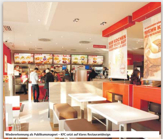
Wiedererkennung als Publikumsmagnet – KFC setzt auf klares Restaurantdesign

KFC wird die Zahl der Restaurants in Deutschland kräftig erhöhen – von aktuell