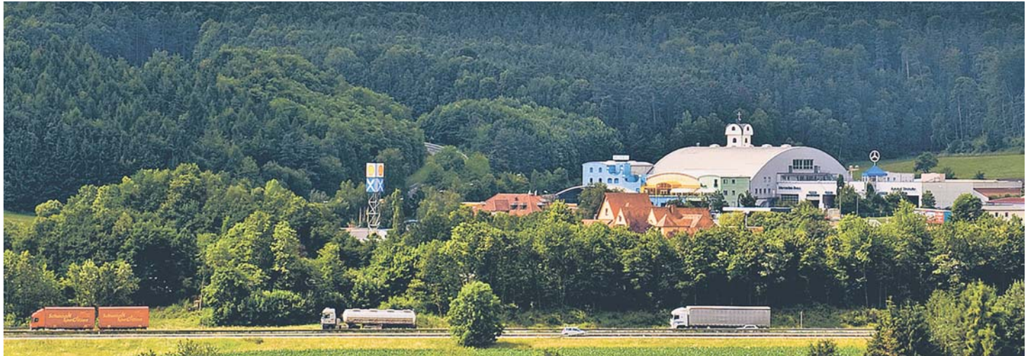
Der Autohof Strohofer an der A 3 in Geiselwind mit Eventhalle, Hotel, Metzgerei und eigener Kirche ist einer der größten Autohöfe Deutschlands.

Die Autobahnen sind mit Raststätten dicht besetzt, neue Anlagen kaum noch wirtschaftlich zu betreiben. Wer eine Wachstumsstory braucht, baut Autohöfe. Doch auch mit diesen autobahnnahe Versorgern nähert sich der Markt der Sättigung. Die Branche staunt nun über die Ankündigung des Dortmunder Projektentwicklers KLG: Er will ein höherwertiges Konzept mit Hotel an gleich 20 Standorten bundesweit realisieren.