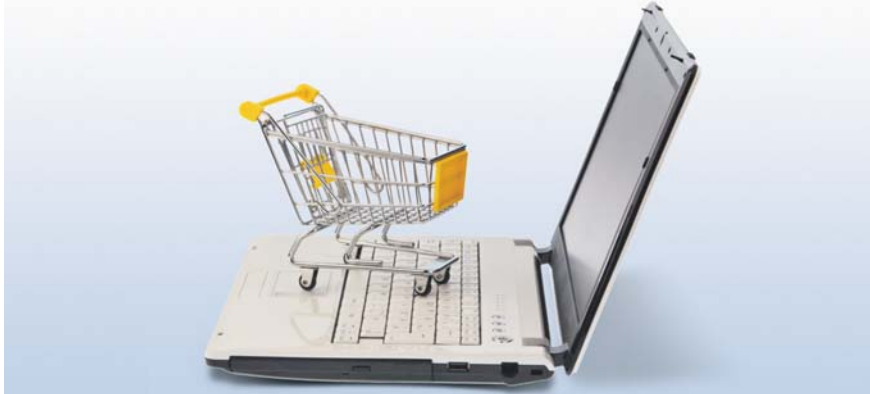
Der Warenkorb bleibt oft leer: Wer neue Kunden mit Online-Gutscheinen locken will, wird oft enttäuscht.

Mit dem Verkauf von jeweils 750 Gutscheinen für Privatanzeigen zur Nachmieter-suche zeigt sich ImmobilienScout24 (IS)