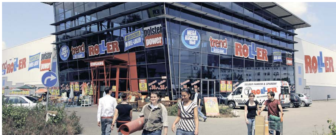
Roller-Markt in Neu-Ulm.