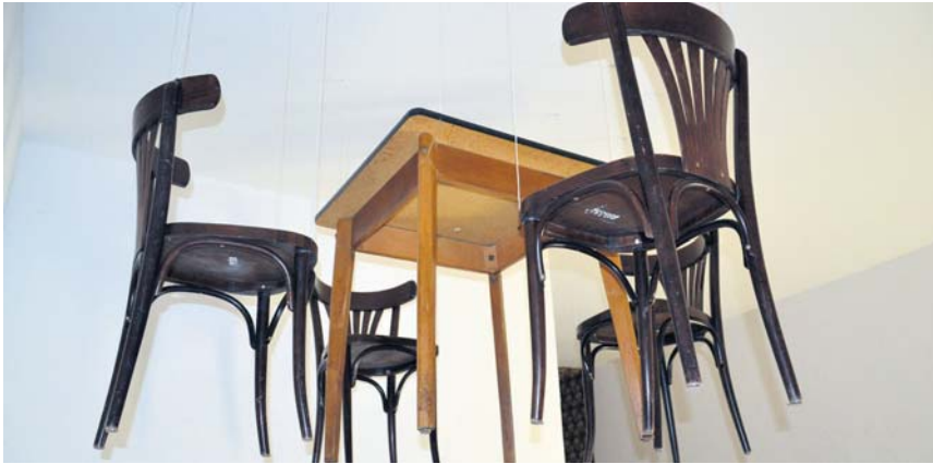
Das untergegangene Hotel öffnete sich Künstlern aus nah und fern. Die legten nicht nur tote Wildschweine in Hotelbetten, sondern hängten nicht mehr gebrauchte Stühle an die Decke.

Für diese Sause spricht ein Blick in die leergekämmten Zimmer des viergeschossigen Gründerzeitbaus. Das Haus ist in seiner über 100-jährigen Geschichte noch nie umfassend saniert worden. Schmale Flure, wellige Tapeten, abgeschabte Teppichböden mit Brandlöchern, bröckelnder Putz und Badezimmer, wie sie keine brandenburgische Fahrradpension ihren Gästen mehr zumutet. „Ist ja echt