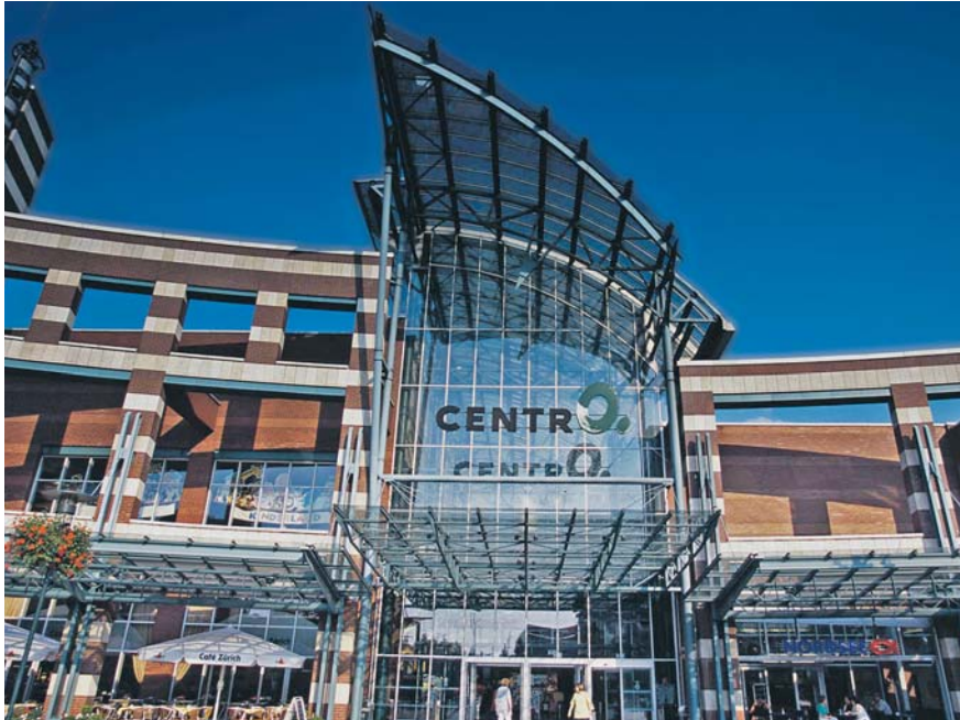
Es muss ja nicht immer gleich ein neues CentRO Oberhausen sein: Die Genehmigung von großflächigen Einzelhandelsimmobilien in NRW wird unter dem geplanten „Sachlichen Teilplan großflächiger Einzelhandel“ wohl nicht leichter.

So klar diese Vorgaben auf den ersten Blick auch scheinen mögen, werfen sie bei