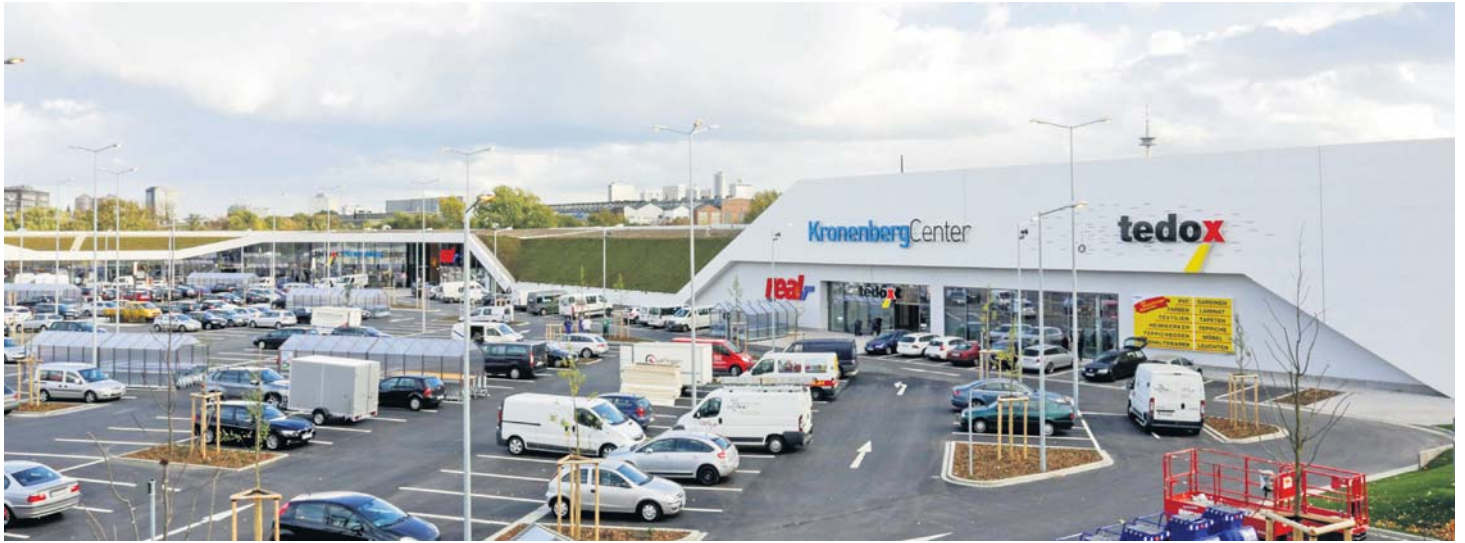
Investoren rechnen mit steigenden Preisen bei Fachmarktzentren. Das Bild zeigt das Kronenberg Center in Essen.

Investoren setzen noch stärker als zuvor auf Handelsimmobilien im sicheren Hafen Deutschland. So will jeder zweite institutionelle Investor in den nächsten zwölf Monaten Einzelhandelsimmobilien kaufen. Im vergangenen Jahr war es nur jeder dritte. Das ist ein Ergebnis des Hahn Retail Real Estate Reports 2014/15, den die auf Fachmarktzentren spezialisierte Hahn-Gruppe mit CBRE und GfK Geomarketing erstellt hat.