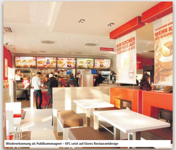
Wiedererkennung als Publikumsmagnet – KFC setzt auf klares Restaurantdesign

KFC wird die Zahl der Restaurants in Deutschland kräftig erhöhen – von aktuell