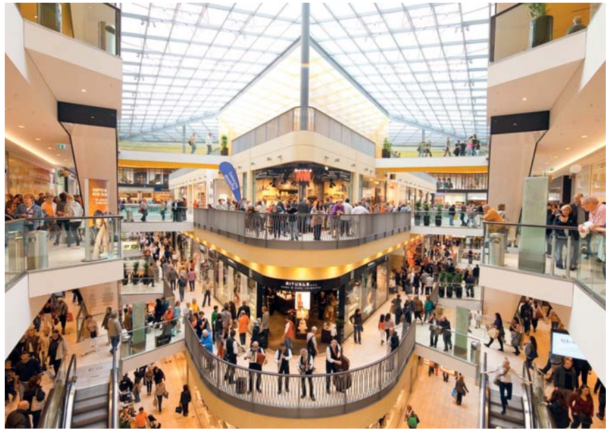
Mit der Dortmunder Tier Galerie besitzt Hamburg Trust auch ein großes Shoppingcenter in Nordrhein-Westfalen.