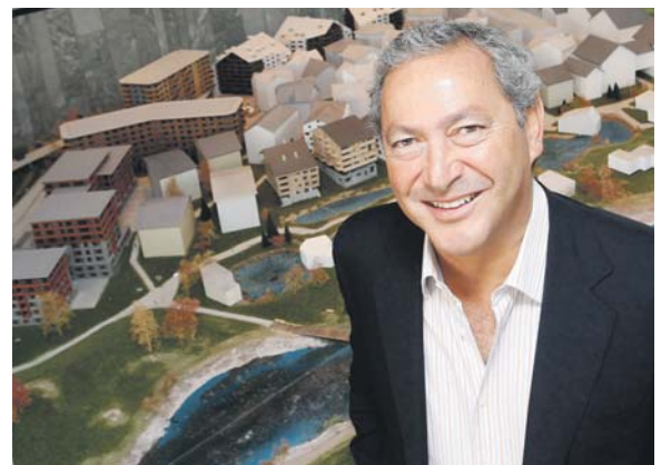
Samih Sawiris vor einem Modell der Ferienstadt Andermatt Swiss Alps.