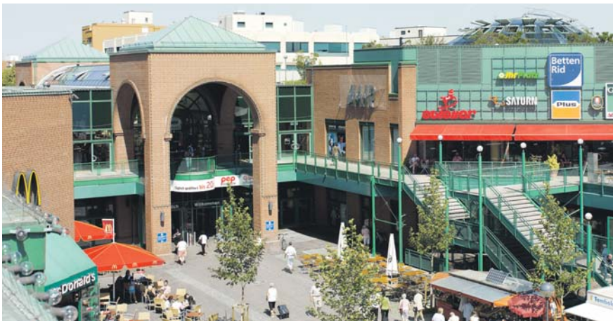
Einkaufszentrum PEP in München-Neuperlach.

Viele Experten fühlen sich durch den Shoppingcenter Performance Report („Lago ist bestes Shoppingcenter“, IZ 38/13) herausgefordert.