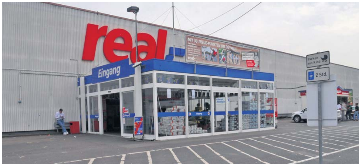
Der real-Markt in der Mainzer Straße in Wiesbaden müsste dringend renoviert werden.