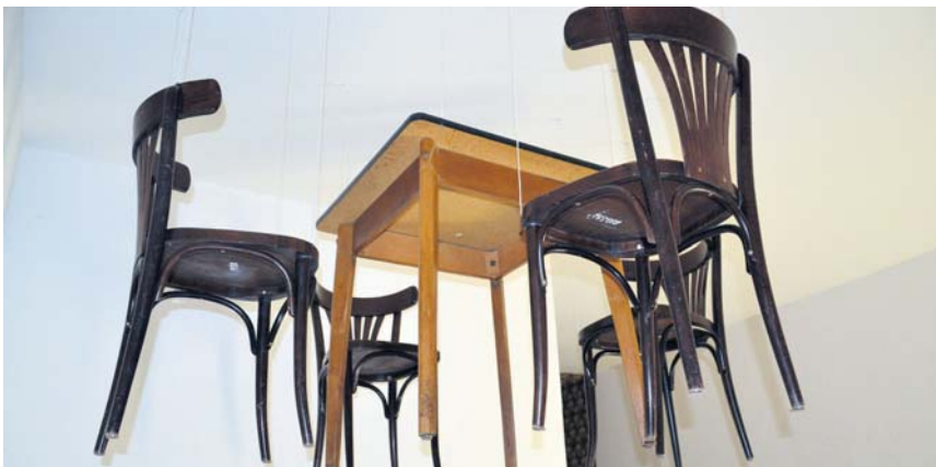
Das untergegangene Hotel öffnete sich Künstlern aus nah und fern. Die legten nicht nur tote Wildschweine in Hotelbetten, sondern hängten nicht mehr gebrauchte Stühle an die Decke.

Für diese Sause spricht ein Blick in die leergekämmten Zimmer des viergeschoßigen Gründerzeitbaus. Das Haus ist in seiner über 100-jährigen Geschichte noch nie umfassend saniert worden. Schmale Flure, wellige Tapeten, abgeschabte Teppichböden mit Brandlöchern, bröckelnder Putz und Badezimmer, wie sie keine brandenburgische Fahrradpension ihren Gästen mehr zumutet. „Ist ja echt