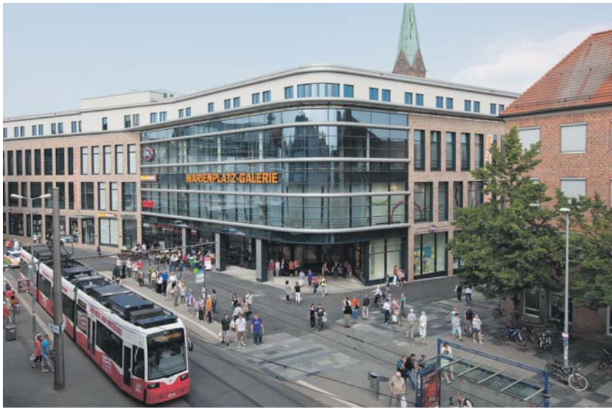
Für eine Versicherung solide genug: Co-Investor der Marienplatz-Galerie in Schwerin ist die AachenMünchener.