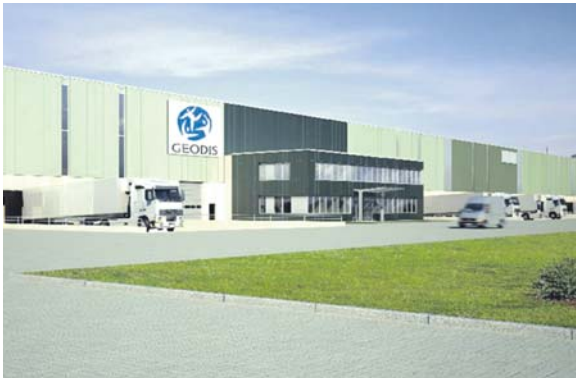
An diesem Logistik-Projekt des Entwicklers Habacker Holding in Nieder-Olm bei Mainz beteiligt sich der Projektentwicklungsfonds von Competo.

Die Münchner Beteiligungsgesellschaft Competo Capital Partners hat für ihren vier Jahre alten Projektentwicklungsfonds die Eigenkapitalgeber vier und fünf akquiriert. Damit verfügt der Fonds nun über ein Potenzial von mehr als 150 Mio. Euro Eigenkapital. Das reicht für Projektentwicklungen mit einem Gesamtvolumen von 750 Mio. Euro. Zurzeit ist das Competo-Produkt an Developments im Umfang von 460 Mio. Euro beteiligt.