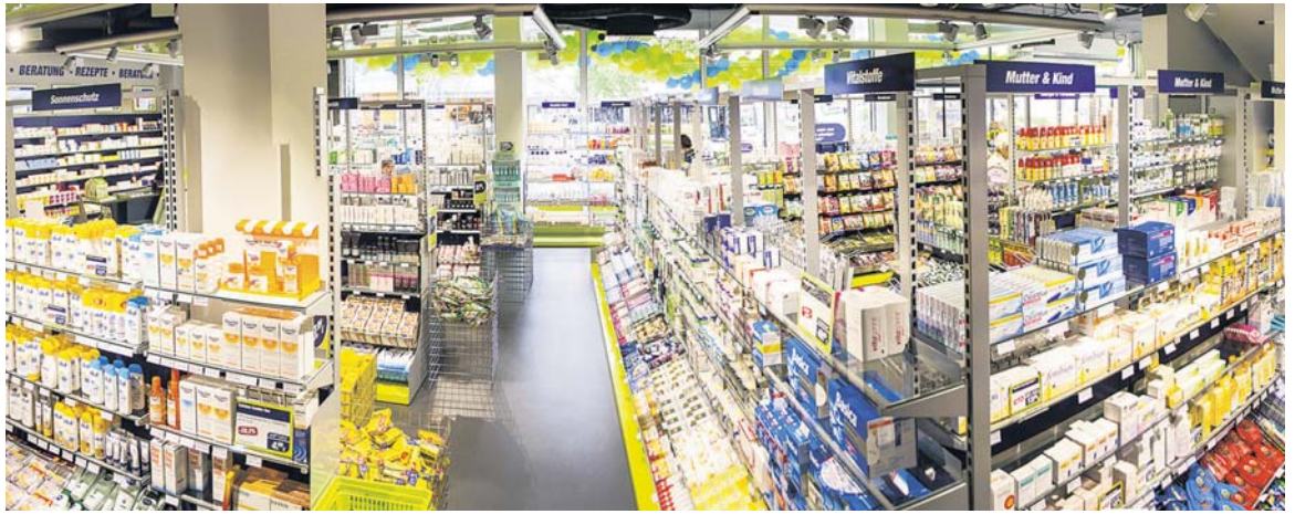
4.000 Produkte hat die easyApotheke im Freiwahlbereich, zehn Mal so viele wie eine normale Apotheke.

Das Kartellamt hat die Jibi-Übernahme auch deshalb genehmigt, damit Edeka in Ostwestfalen einen stärkeren Konkurrenten bekommt. Andreas Mundt, Präsident des Amtes, erwartet eine „gewisse Belebung des Marktes“. Weiter sagt er: „Die Freigabe zeigt, dass es für kleinere Lebensmittelhändler im Falle einer Veräußerung durchaus Alternativen zu Edeka und Rewe gibt.“ 2013 hat Bunting mit dem Segen des Kartellamts 33 Minipreis-Märkte geschluckt. ma/cvs