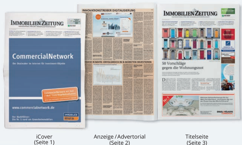
iCover (Seite 1)

Das iCover kann als Anzeigenfläche oder Advertorial genutzt werden. Der echten Seite 1 vorgeschaltet liegt eine „falsche Seite 1“, deren Rückseite mit der Werbefläche einer ganzen Seite eine besonders prominente Platzierung gegenüber der echten Seite 1 bietet. Preis: 52.335 €